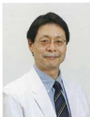
特定医療法人 健康会 理事長