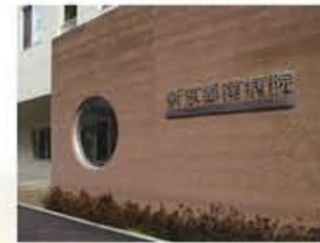
正面玄関 古都をイメージしたデザイン

高度な医療の提供はもちろん、優秀な専門スタッフが患者さんをあらゆる角度からサポートします！