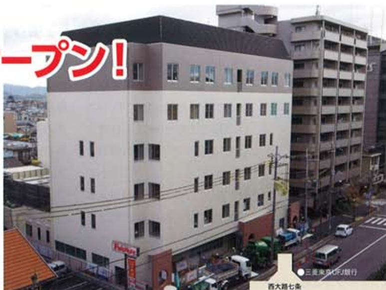
西大路通から見た外観