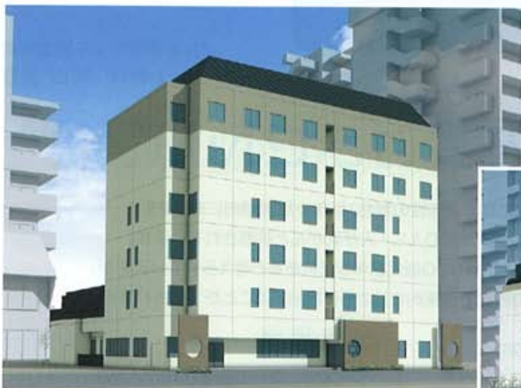
西大路側イメージパース