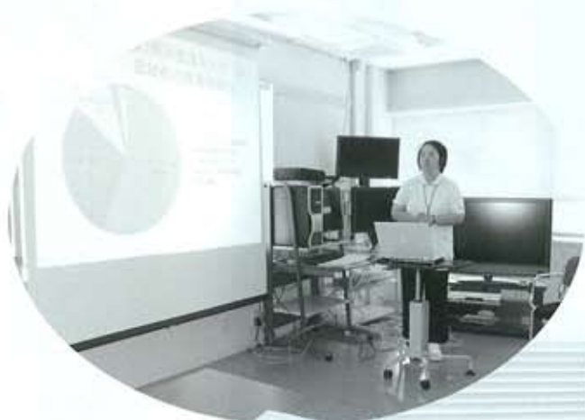
プレゼンテーションによる指導風景

質の高い認知症看護を実践する看護師を育成するために、2005年から看護研修学校(東京)に認知症看護学科が新設され教育が開始されました。これまで教育課程がこの一校だけであったこともあり、現在、認知症看護認定看護師は122名と、他の領域と比べて非常に少ないといえます。今年より兵庫県看護協会において認知症看護コースが開設され、そこより実習生をお迎えしたというわけです。