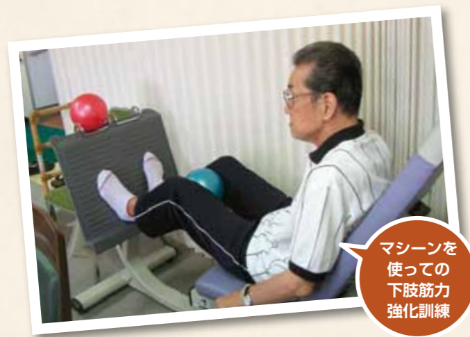
マシンを使っての 下肢筋力 強化訓練

両者の見境はますます付きにくくなっています。国もそうした問題は認識しているようで、将来的には一つの物にするような話も取りざたされています。