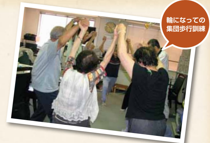
輪になったの 集団歩行訓練