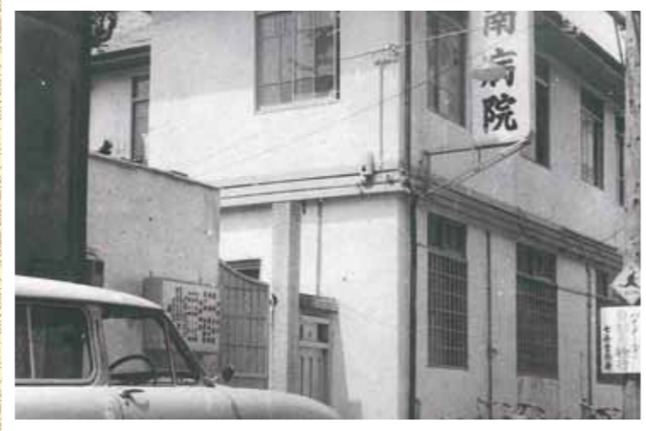
▲昭和35年当時の南病院（現在の第二南診療所の地で開院）

また、1998年（平成10）には救急部の正式発足、グループホーム「ぬくもりの里」の開所と、こちらは15年目を迎えます。