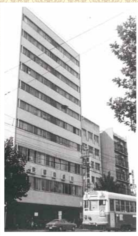
昭和50年（現在の地での京都南病院。まだ市電が走っています）▶