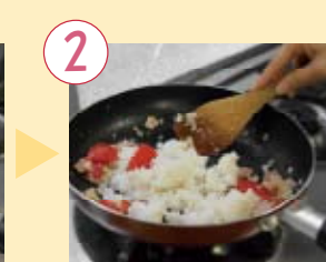
2 玉ねぎがしんなりしたら、豆乳を加え混ぜる。