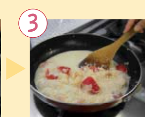
3 豆乳とコンソメスープの素を加え、混ぜながら中火で5分ほど煮る。