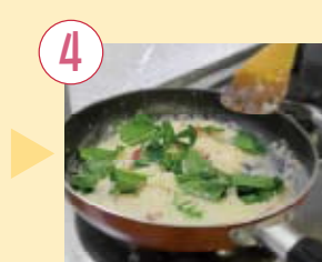
4 一口大に切ったほうれん草を入れ、黒胡椒・塩で味を整え、器に盛り、粉チーズをかける。