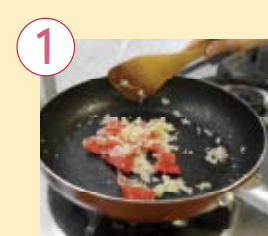
1 パターを熱したフライパンで左の材料を炒める。